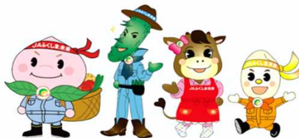
＜JAふくしま未来イメージキャラクター＞